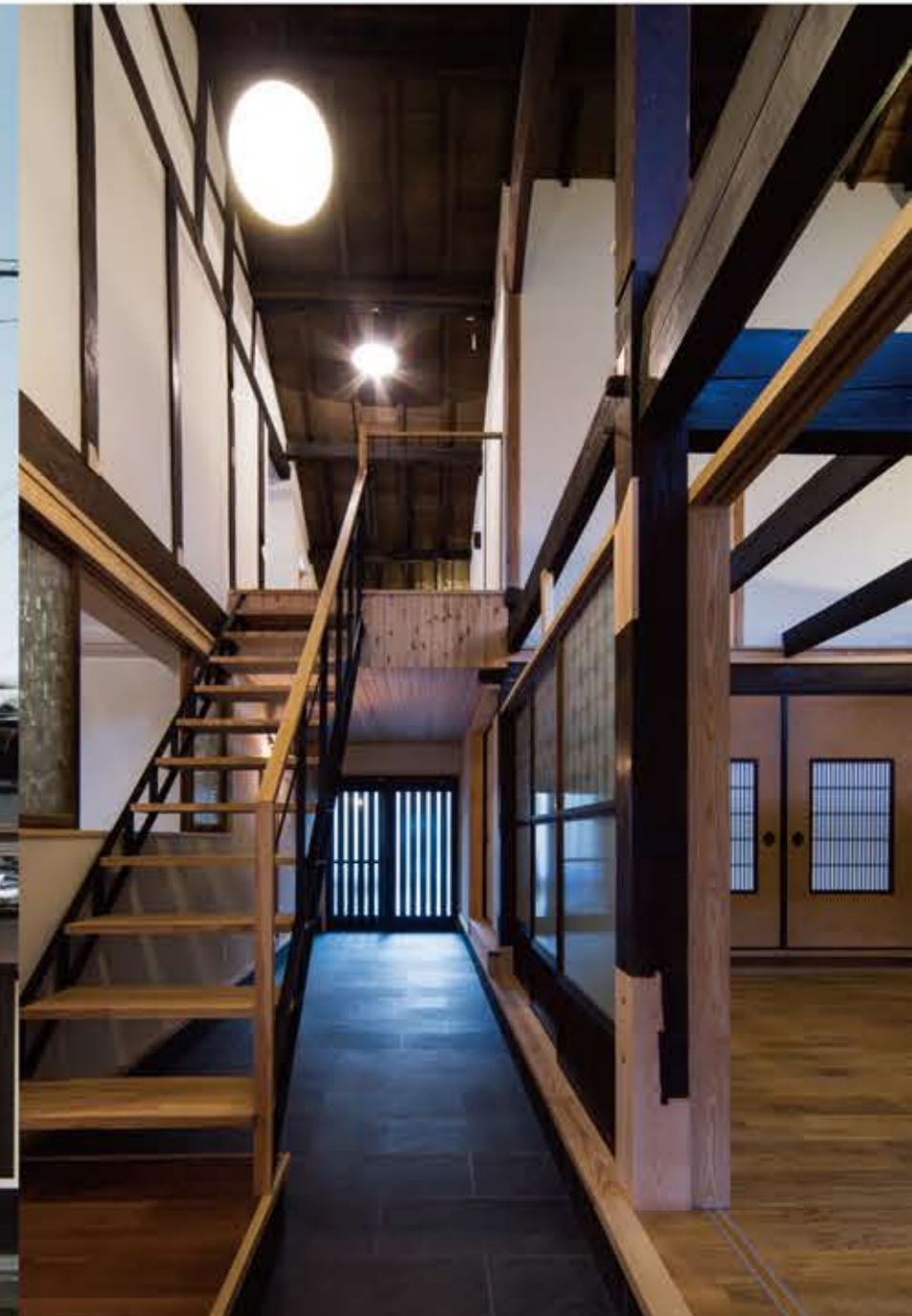
道路と裏庭をつなぐ通り土間