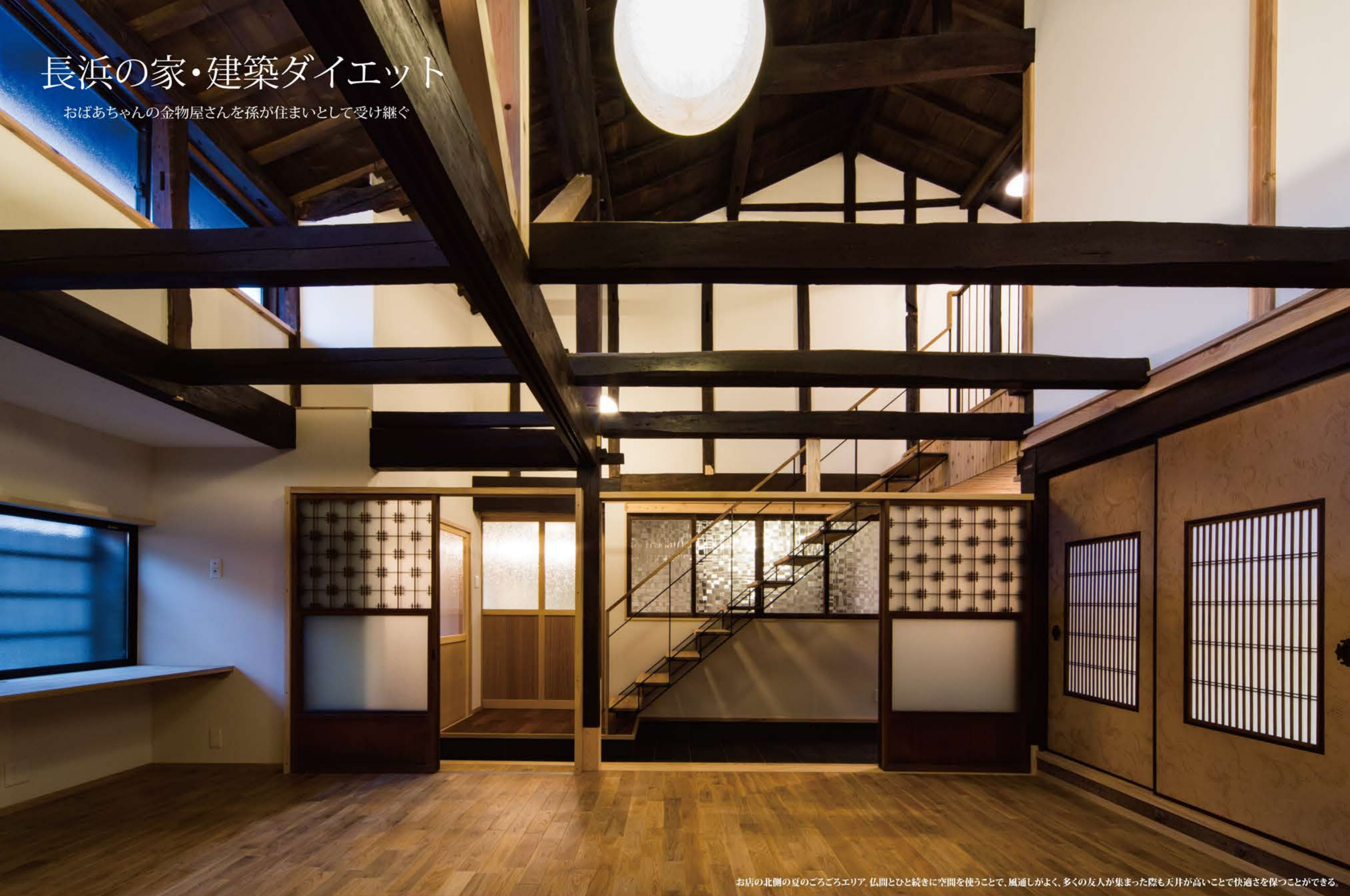
お店の北側の夏のごろごエリア。仏間とひと続きに空間を使うことで、風通しがよく、多くの友人が集まった際も天井が高いことで快適さを保つことができる。

積雪を考慮した構造補強。町屋カフェのような吹き抜けと小屋組み。図書室のような本棚。親子で並んで料理できるキッチン。出入りしやすいカーポート。書斎コーナー。かっこいい格子窓。縁側で読書。融雪のための井戸で冷えたスイカ。芝生を走り回る子供。古い建具のガラスがすき。…が〈ご要望〉であり、生活イメージで対話しました。