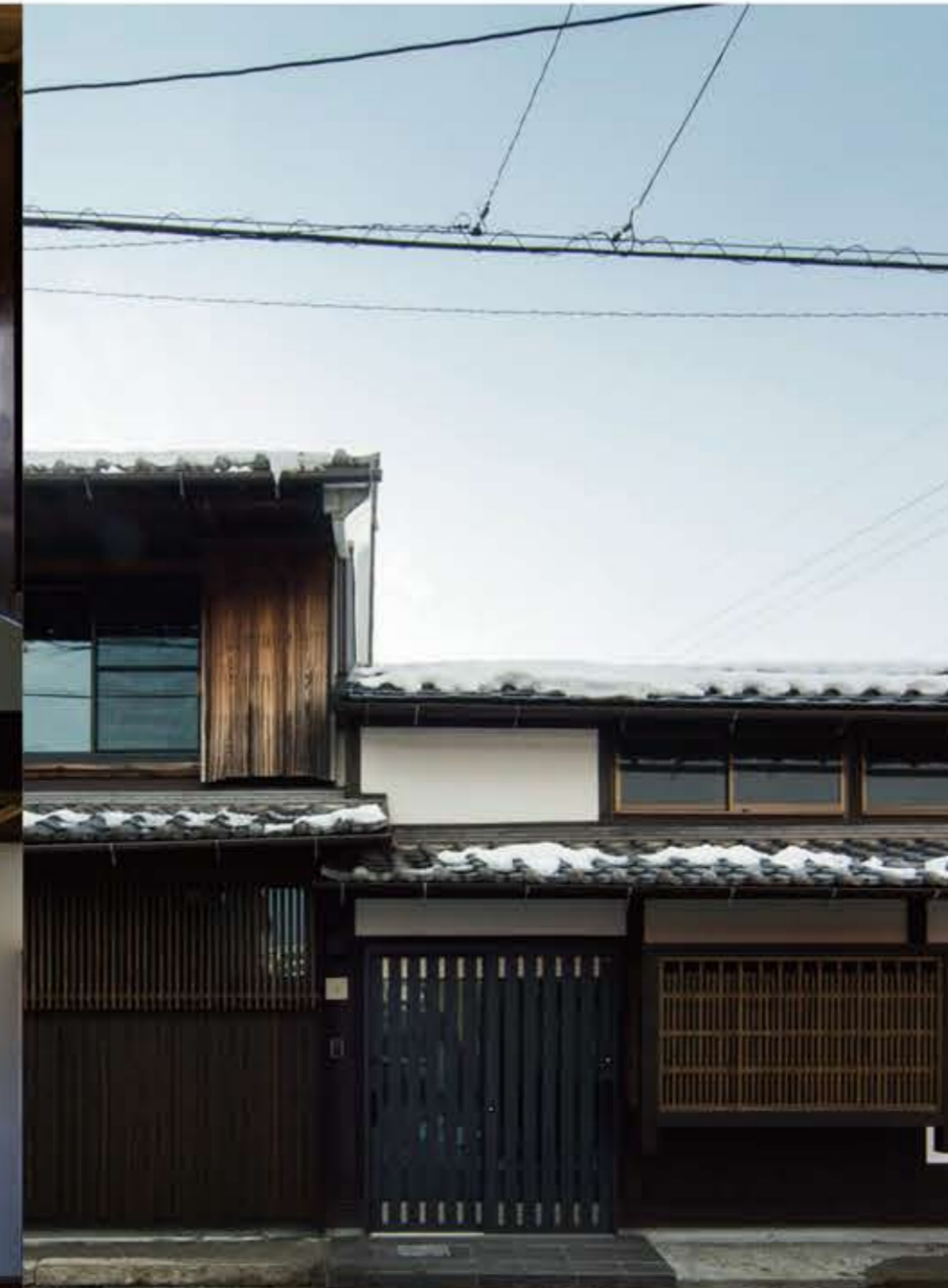
道路より玄関を見る