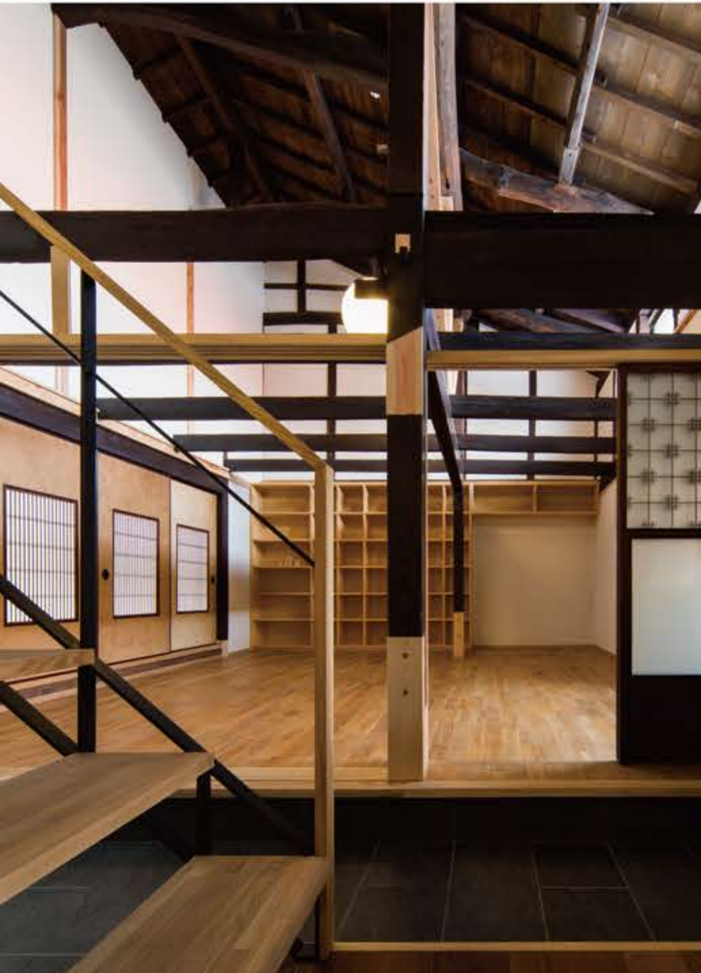
古い柱・梁も埋め木や根継ぎをして、できるだけ保存している。通り土間と上間リビングは古い建具で仕切ること視線を限定し、落ち着きのある空間をつくらせている。