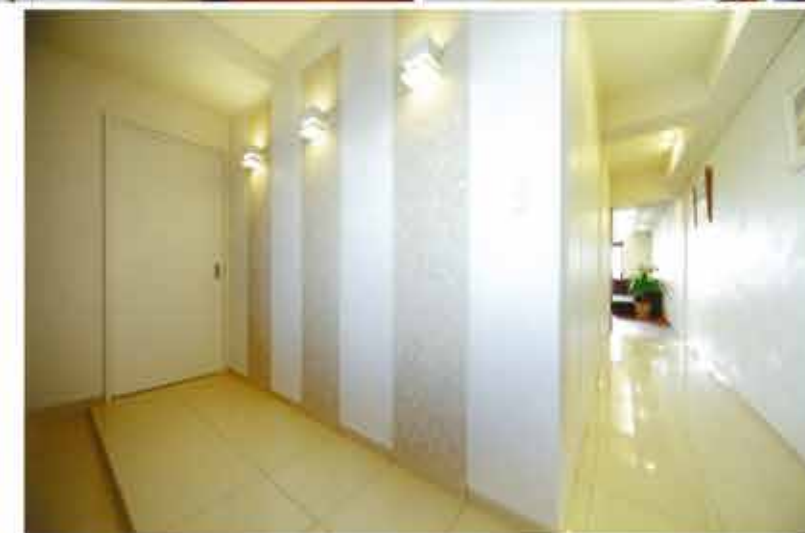
Before 開まれたキッチンの一般的な間取りのマンション