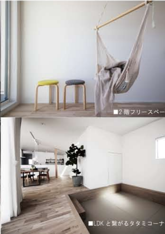
■2階フリースペース 屋根や壁で、周囲の視線を遮りプライバシーを確保