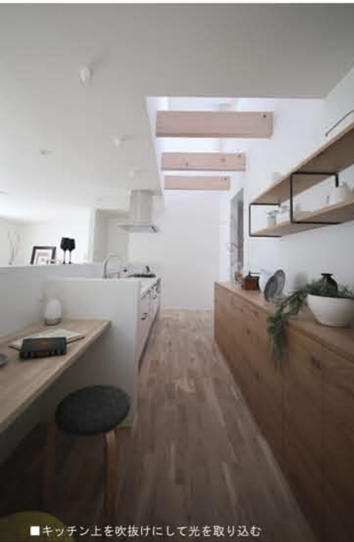
■キッチン上を吹抜けにして光を取り込む