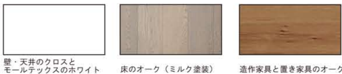
壁・天井のクロスとモルテックスのホワイト 床のオーク（ミルク塗装） 造作家具と置き家具のオーク