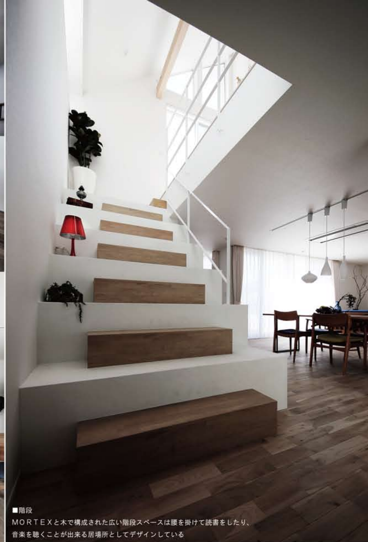
■階段 MORTEXと木で構成された広い階段スペースは腰を掛けて読書をしたり、音楽を聴くことが出来る居場所としてデザインしている