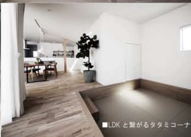
■LDKと繋がるタタミコーナー