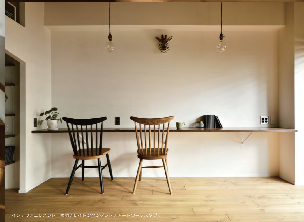
インテリアエレメント：照明 / レイトンペンダント / アートワークスタジオ