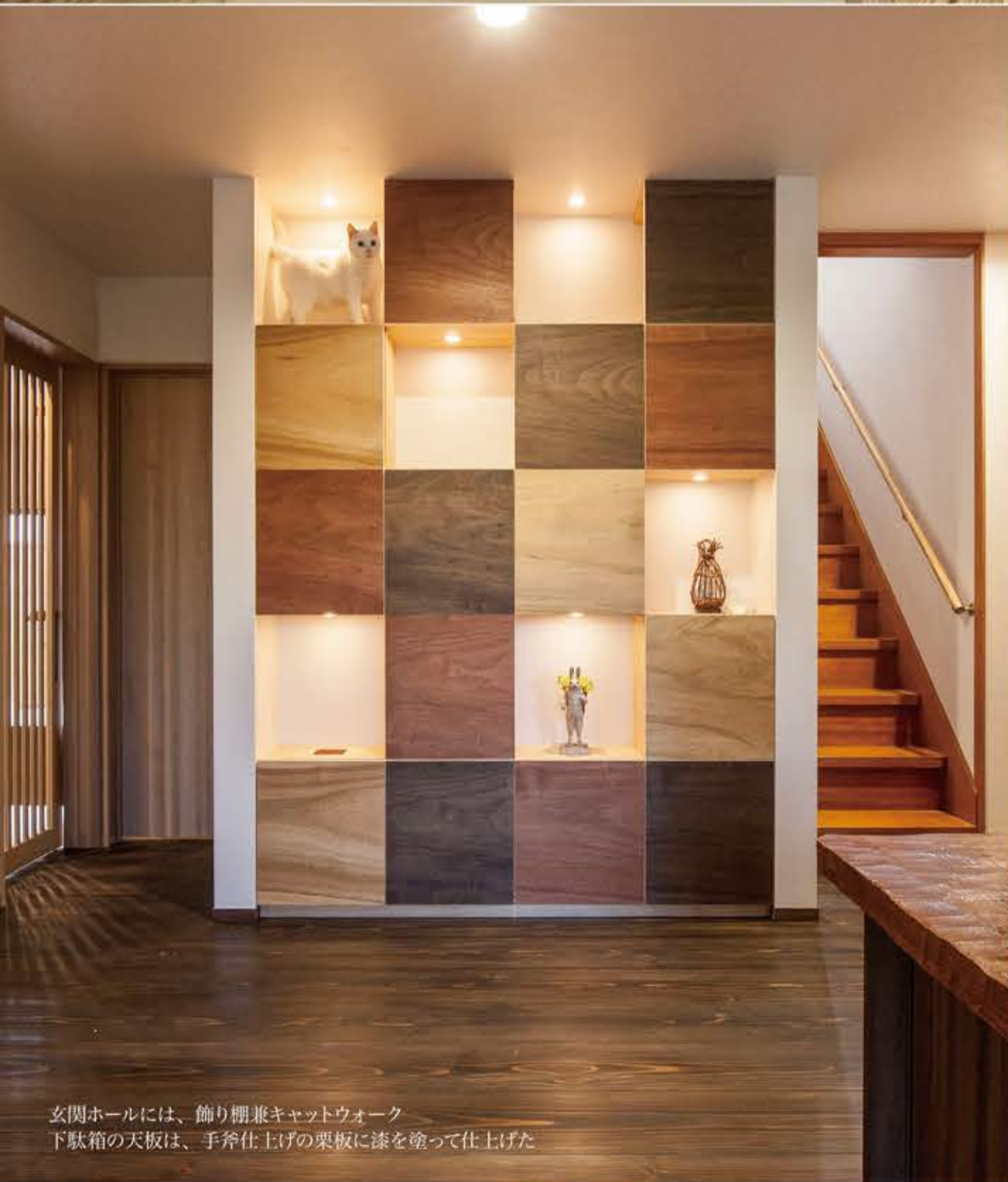
玄関ホールには、飾り棚兼キャットウォーク 下駄箱の天板は、手斧仕上げの栗板を塗って仕上げた

主なインテリアエレメント【玄関ホール】床：相生杉ウッドワックスオークふき取り クリアー3分つや 樺一枚板壁 / 壁：シンコールクロス / 天井：シンコールクロス / 製作飾り棚兼キャットウォーク杉三層 パネルクリア仕上げ / 製作シューズクローク(カウンター：栗手斧仕上げ拭き漆 / 扉：楠単板オイル仕上げ) 堅格子(樺無垢材ノロット仕上げ) 玄関手摺(漆仕上げ) 【LDK・図書室・居室】床：ウッドテック ピュ アハードウォールナット / 壁：シンコールクロス(一部INAXエコカラット) / 天井：シンコールクロ ス / 製作TVボード兼キャットウォーク：楠一枚板カウンター オイル仕上げ / 製作ダイニングテー ブル 楠一枚板ウレタン仕上げ / 製作ワゴン：楠一枚板ゴム集成材ウレタン仕上げ / 製作プランター台： 楠一枚板ウレタン仕上げ / 製作本棚兼キャットウォーク：杉三層パネル【茶室】床：琉球産市松 栗手斧 仕上げ 杉浮造り 床板既存の杉絞り丸太加工 / 壁：けいそうモダンコート 藁入り柳引仕上げ モミジ木取 り / 天井：茶銅代 竹網代 杉浮造り 錆竹竿縁 / 襖：京町家襖 市松 葛布 / 障子：ワロン紙竹格子 ワ ロン紙潮れ竹筒仕上げ格子 / 床柱：松筒丸太 皮付き百日紅 / 縁台：杉 錆竹