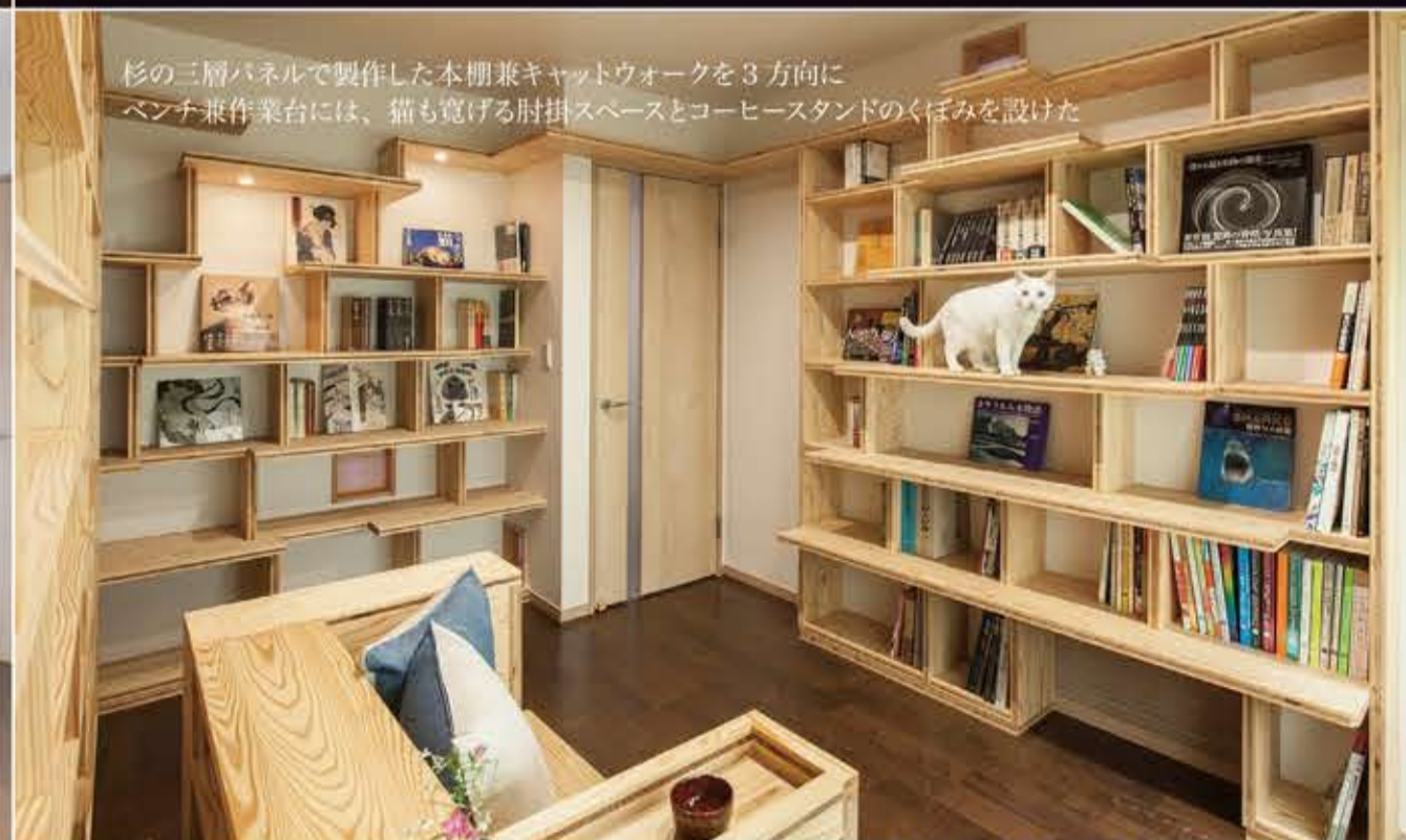
杉の三層パネルで製作した本棚兼キャットウォークを3方向に マンチ兼作業台には、猫も寛げる肘掛スペースとコーヒースタンドのくぼみを設けた