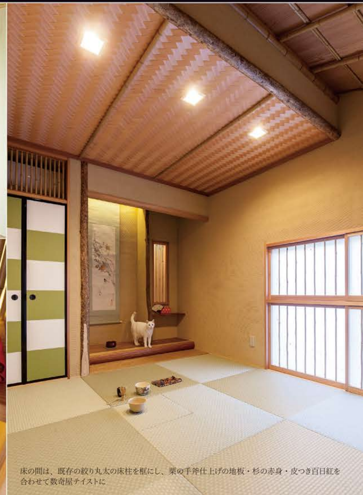
床の間は、既存の紋り丸太の床柱を頼にし、栗の手斧仕上げの地板・杉の赤身・皮つき百日紅を 合わせて数寄屋テイストに