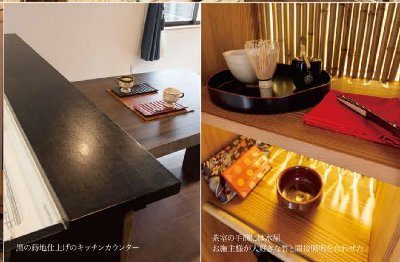
黒の蒔地仕上げのキッチンカウンター