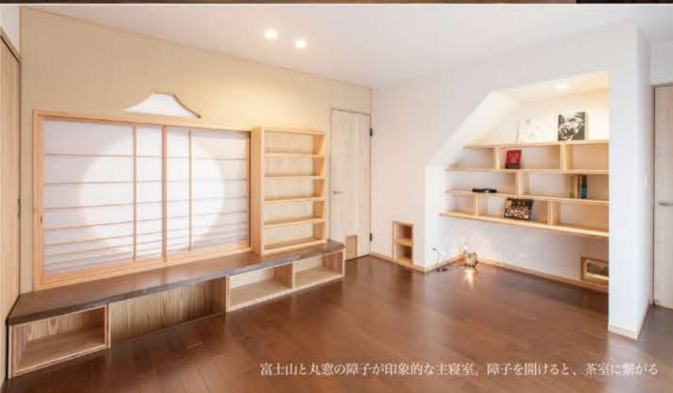
富士山と丸窓の障子が印象的な主寝室。障子を開けると、茶室に繋がる