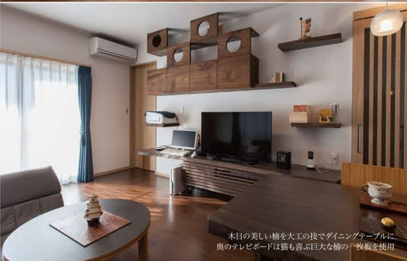
木目の美しい楠を大工の技でダイニングテーブルに 奥のテレビボードは猫も喜ぶ巨大な楠の一枚板を使用