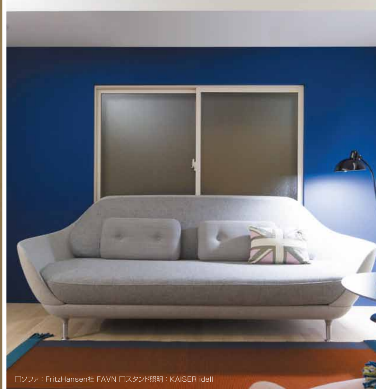
□ソファ：FritzHansen社 FAVN □スタンド照明：KAISER idell