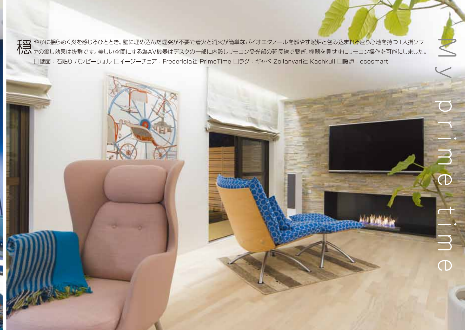
穏 やかに揺らめく炎を感じるひととき。壁に埋め込んだ煙突が不要で着火と消火が簡単なバイオエタノールを燃やす暖炉と包み込まれる座り心地を持つ1人掛ソファの癒し効果は抜群です。美しい空間にする為AV機器はデスクの一部に内設しリモコン受光部の延長線で繋ぎ、機器を見せずにリモコン操作を可能にしました。□壁面：石貼り パンビーウォール □イージーチェア：Fredericia社 PrimeTime □ラグ：ギャベ Zollanvari社 Kashkuli □暖炉：ecosmart