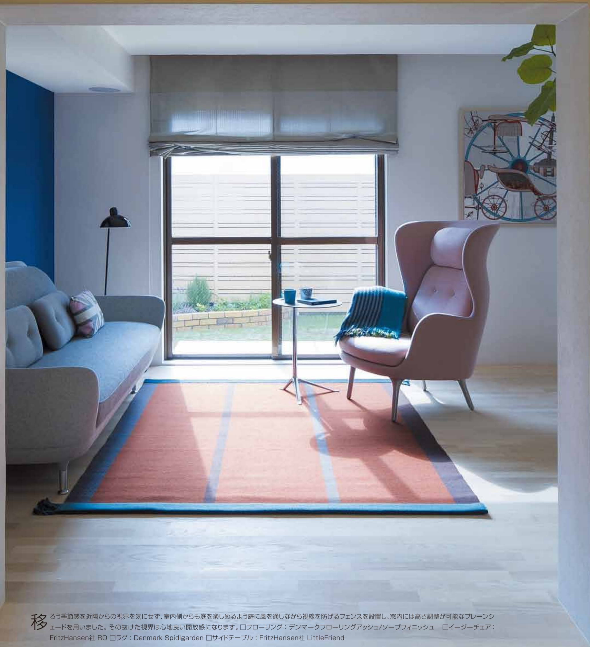
移 ろう季節感を近隣の視界を気にせず、室内側からも庭を楽しむよう庭に風を通しながら視線を防げるフェンスを設置し、窓内には高さ調整が可能なブレンシェードを用いました。その抜けた視界は心地良い開放感になります。□フローリング：デンマークフローリングアッシュ/ソープフィニッシュ □イージーチェア：FritzHansen社 RO □ラグ：Denmark Spildgarden □サイドテーブル：FritzHansen社 LittleFriend