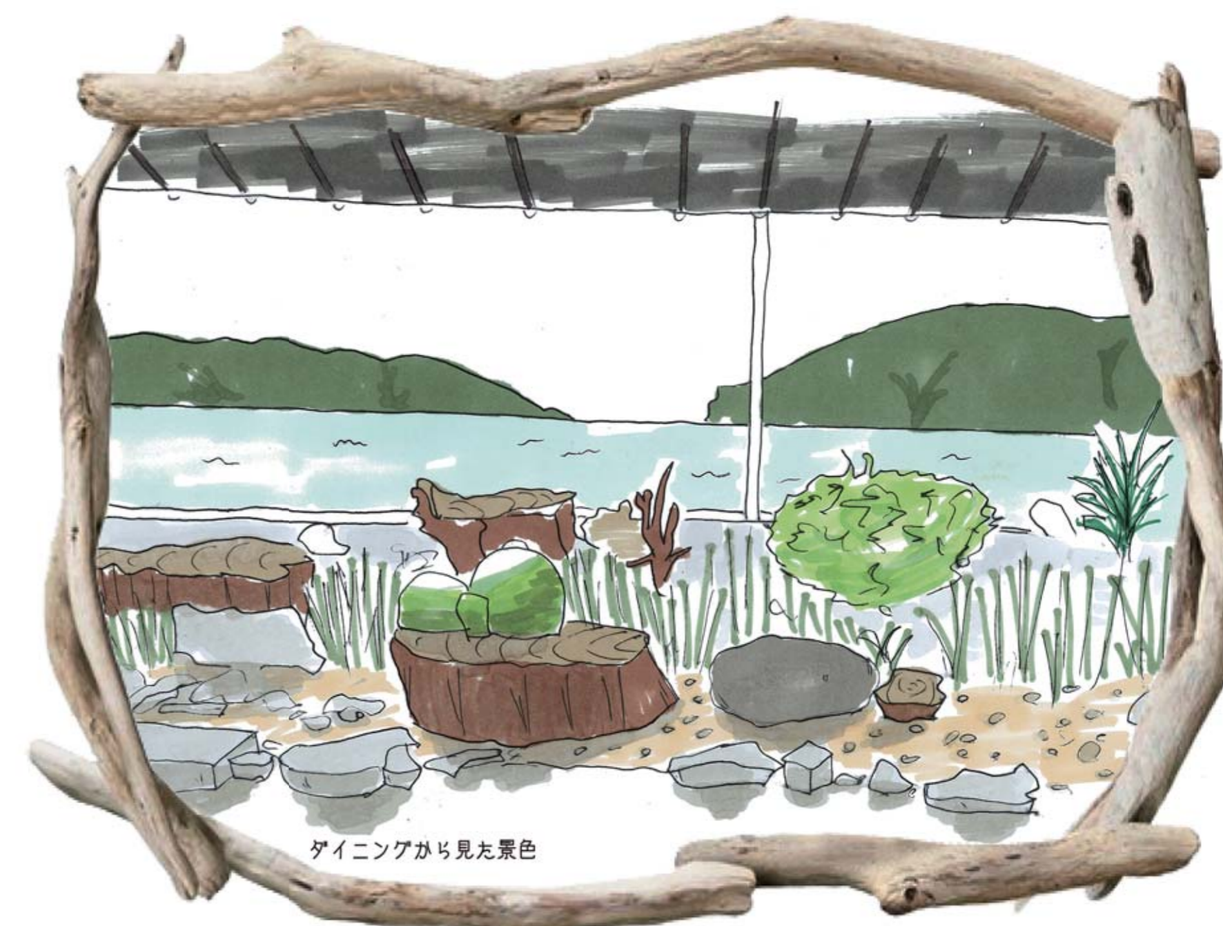
海が目の前に広がる。この場所にいる家族だけが見える特別な景色