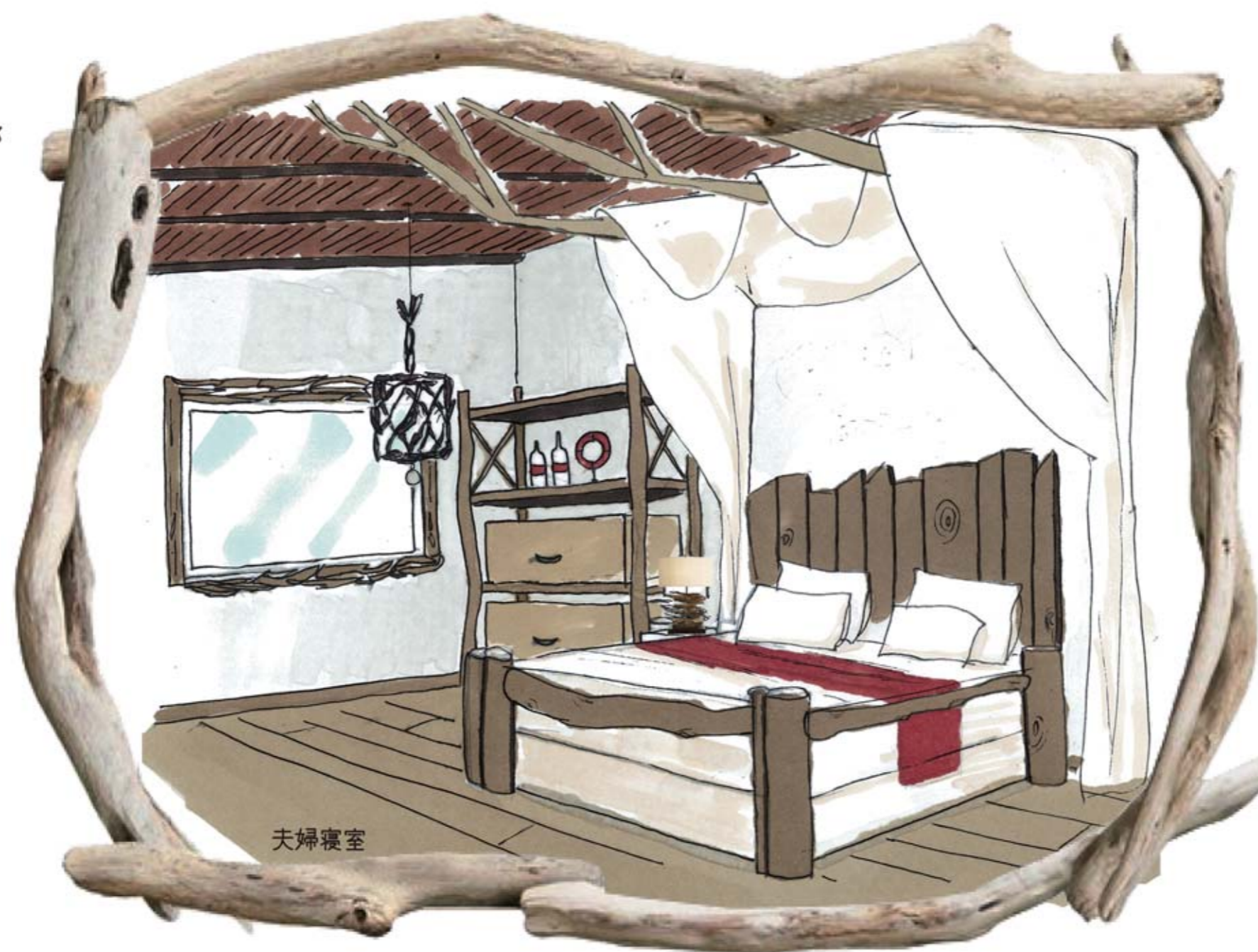
流木インテリアを使い、木のあたたかみが広がるお部屋