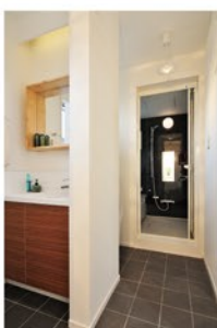
トイレは通常より広く取り、座りながら景色を眺められるように。真白な空間が木々の葉を引き立たせる。