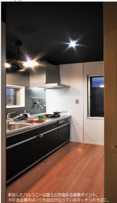
新設したバルコニーは富士山を眺める絶景ポイント。大好きな場所はいつも自分が立っているキッチンのそばに。