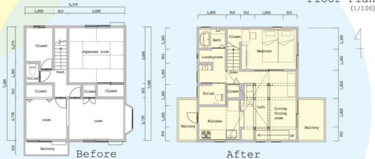
Floor Plan (1/100)

木造2階建（2階部分のみ改修） 築年数 / 20年 総工事床面積 / 46.37㎡ 家族構成 / 夫婦、子供1名 （1階に親世帯2名居住） 概算工事金額 / 960万円