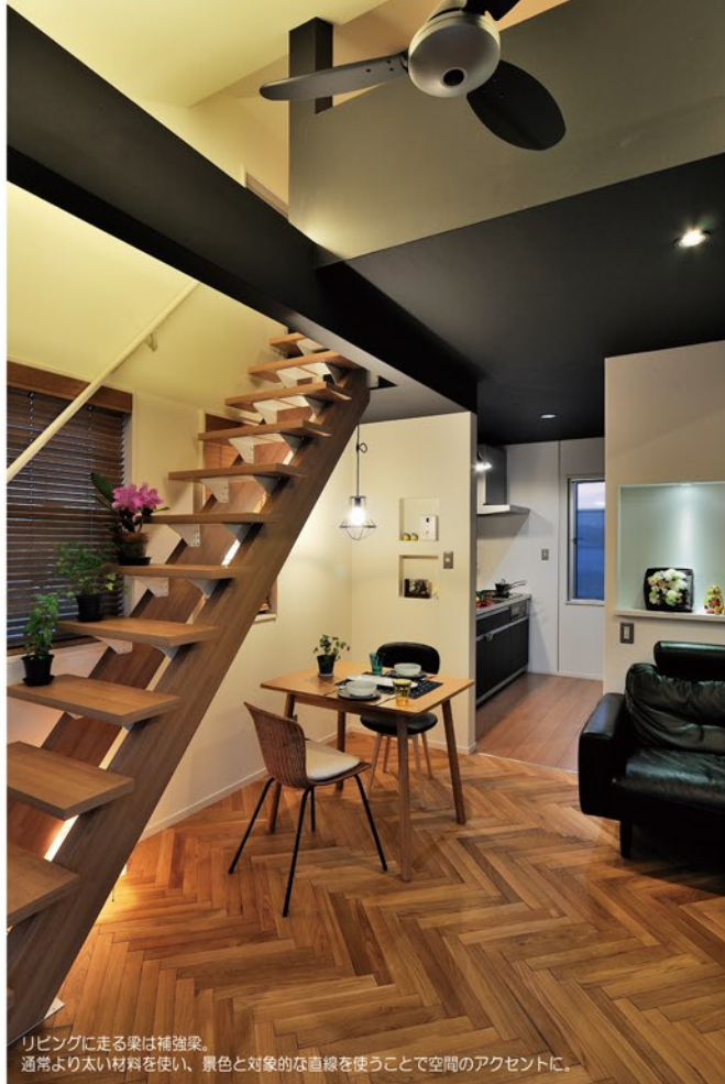
リビングに走る梁は補強梁。通常より太い材料を使い、景色と対象的な直線を使うことで空間のアクセントに。