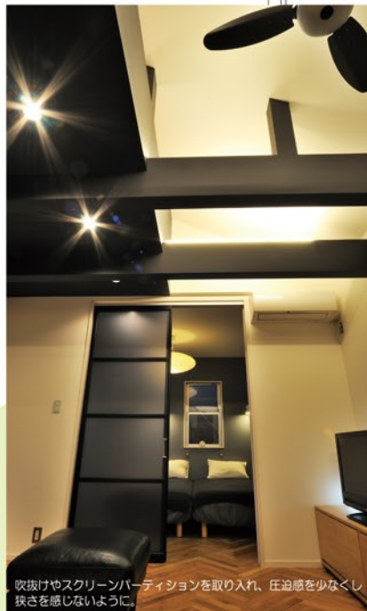
吹抜けやスクリーンパーティションを取り入れ、圧迫感を少なくし狭さを感じないように。