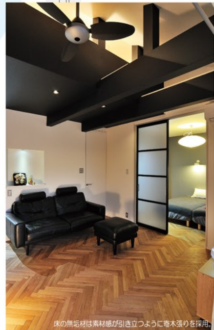
床の無垢材は素材感が引き立つように寄木張りを採用。