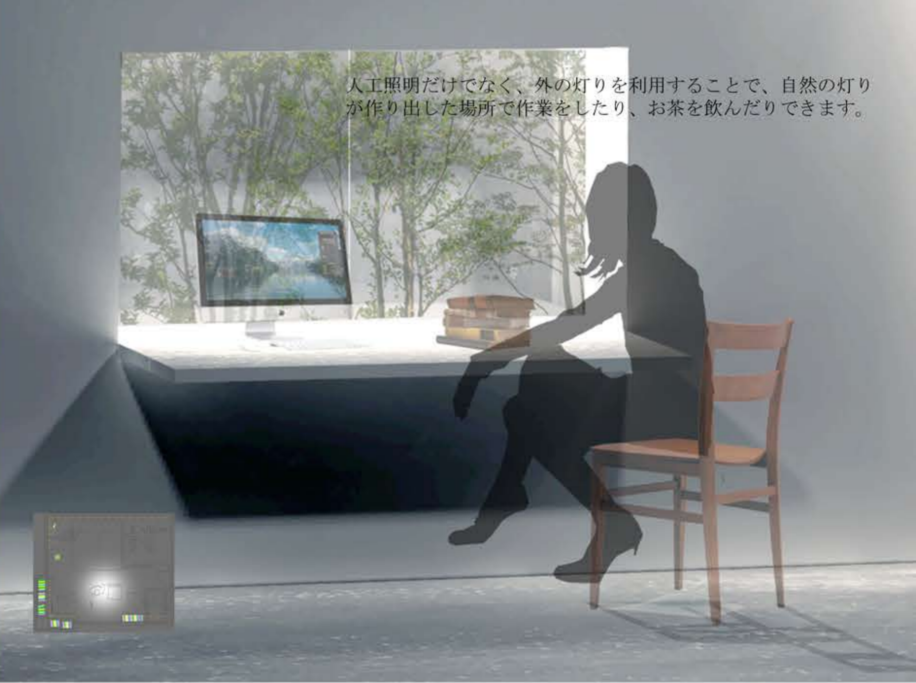
人工照明だけでなく、外の灯りを利用することで、自然の灯りが作り出した場所で作業をしたり、お茶を飲んだりできます。