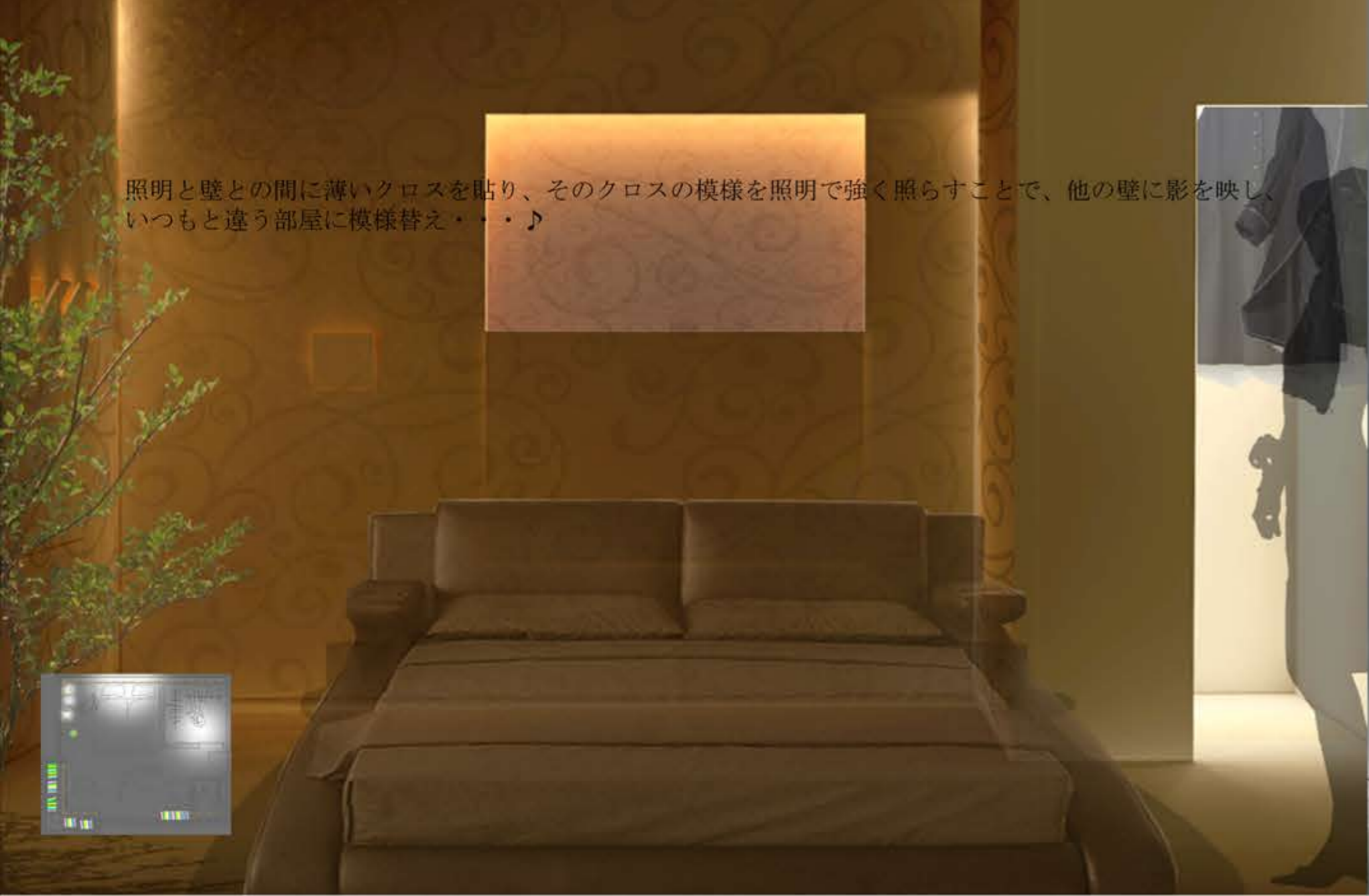
照明と壁との間に薄いクロスを貼り、そのクロスの模様を照明で強く照らすことで、他の壁に影を映し、いつもと違う部屋に模様替え・・・♪