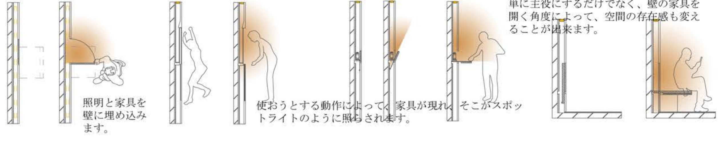
照明と家具を壁に埋め込みます。