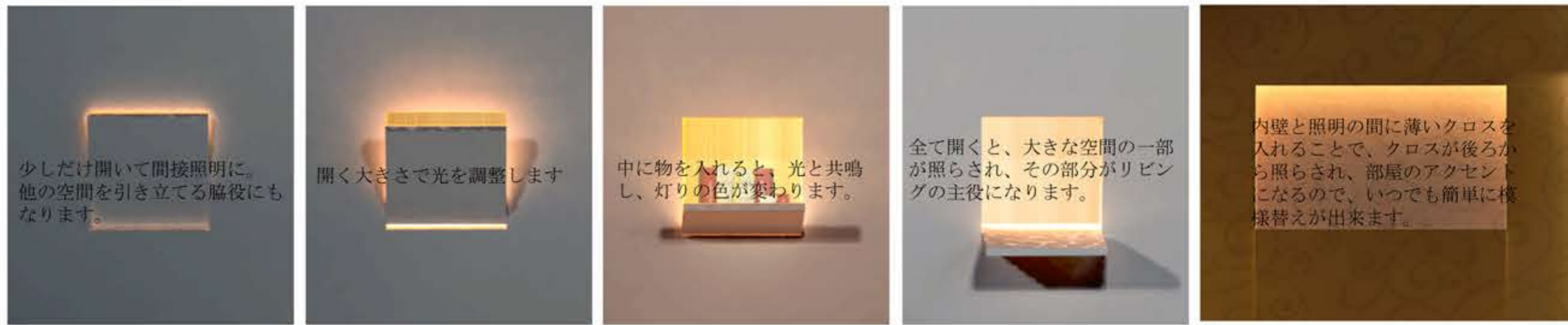
少しだけ開いて間接照明に。他の空間を引き立てる脇役にもなります。