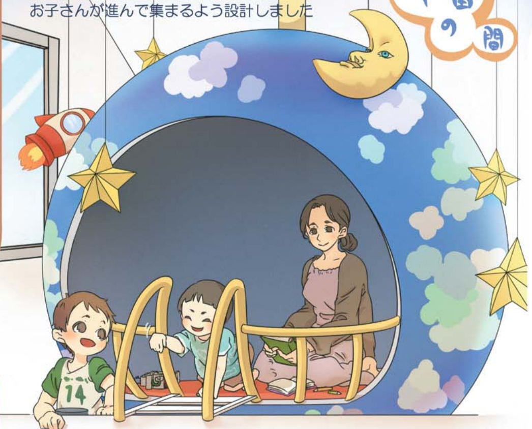
▼2F このリビングのメインとなる空間です お子さんが進んで集まるよう設計しました