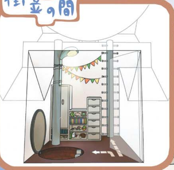
▲1F この部屋から上下に空間が展開されています